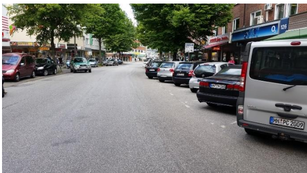
Verkehrsflächen vor dem Umbau

Deutscher Ingenieurpreis Straße und Verkehr 2017 (Nominierung)